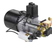
MTP KMR Gold