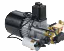
MTP KMR Gold