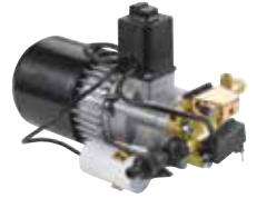
MTP KMR Gold