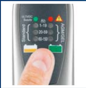
Fácil de usar – un botón cubre todas las funciones.

Comprobar y recargar regularmente la batería no solo permite que siempre esté operativa sino también alarga su vida útil.