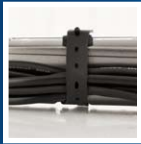
Cableado de fácil manejo gracias a la correa de sujeción.