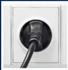
Conecte el enchufe del cargador a la toma de corriente.

Asegúrese de que la batería esté limpia y seca, especialmente alrededor de los terminales. Restos de agua, aceite, moho u otras partículas pueden fomentar la auto-descarga. Utilizar un cargador Exide es fácil: