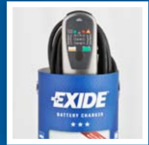
El embalaje sirve para su almacenamiento.