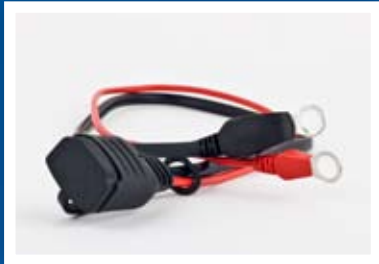
CABLE EXTRA PARA INSTALACIONES DURANTE PERIODOS PROLONGADOS (50 CM)

Más vale prevenir que lamentar. Asegúrese de que tiene cables de repuesto o un par de pinzas cuando los necesite. Un cable más largo para la instalación permanente puede ser útil también en situaciones especiales. Los accesorios están por supuesto equipados con sensores de temperatura integrados.