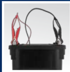
Conecte la pinza roja del cargador al terminal positivo de la batería (+), y la pinza negra al terminal negativo (-).