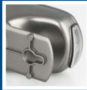
Puede estar colgado o fijado a una pared.