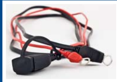
CABLE EXTRA PARA INSTALACIONES DURANTE PERIODOS PROLONGADOS (150 CM)