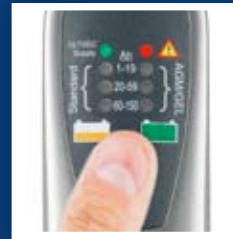
Seleccione el modo correcto, capacidad de la batería (Ah) y tecnología (AGM / GEL o batería convencional). O suministro constante a 13,7 V.