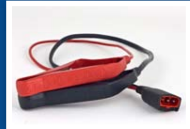
PINZAS DE 50 CM