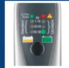
Quando se encienda la luz verde en el modo seleccionado, se da por finalizada la recarga.